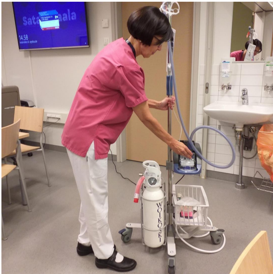
Kuvassa laitevastaava työssään